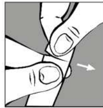
Abdrücken und aufreißen

Talcid Liquid in Stick-Verpackung: einfach einzunehmen und praktisch für unterwegs!