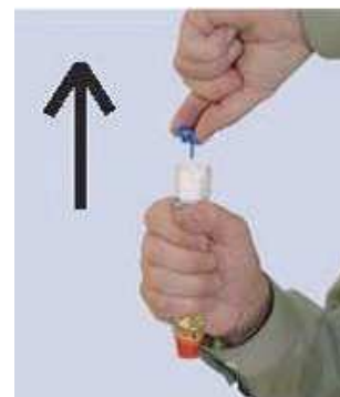
Orangefarbene Spitze (Nadelaustritt!)

Den FASTJEKT Junior in die dominante Hand nehmen. Blaue Sicherheitskappe mit der anderen Hand gerade abziehen. Die orangefarbene Spitze nicht mit den Fingern oder der Hand berühren oder darauf drücken.