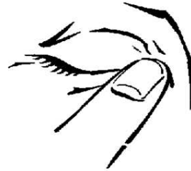
Abbildung 1 Abbildung 2 Abbildung 3 Abbildung 4

Nach Möglichkeit sollten Sie Allergodil akut regelmäßig anwenden, bis Ihre Beschwerden verschwunden sind. Falls Sie die Anwendung von Allergodil akut unterbrechen, können Ihre Beschwerden erneut auftreten.